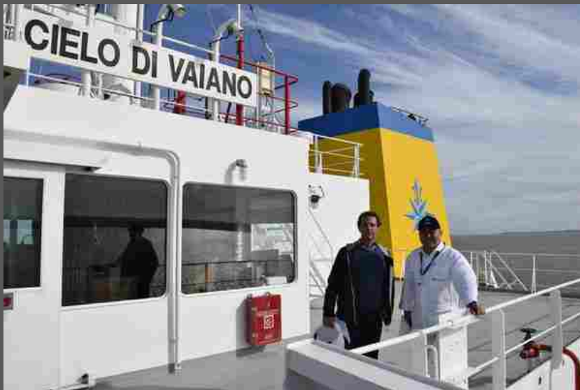
La nave Cielo di Vaiano del gruppo d'Amico

Il Gruppo d'Amico presenta "The Owner's Cabin" il progetto con il quale saranno ospitati a bordo delle proprie navi artisti internazionali per soggiorni finalizzati a creare opere ispirate dal contesto della navigazione.